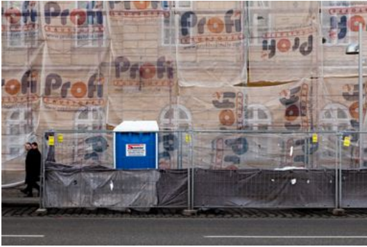
GUT VERPACKT 2018