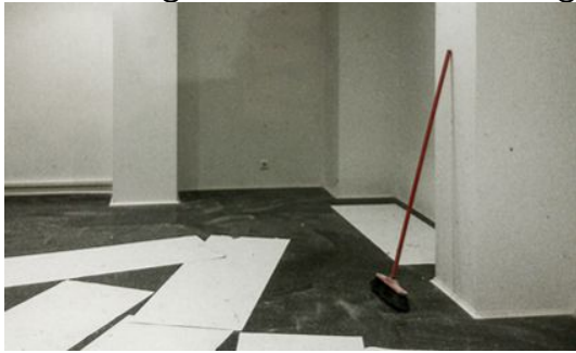
BESEN UND PAPIER 2017