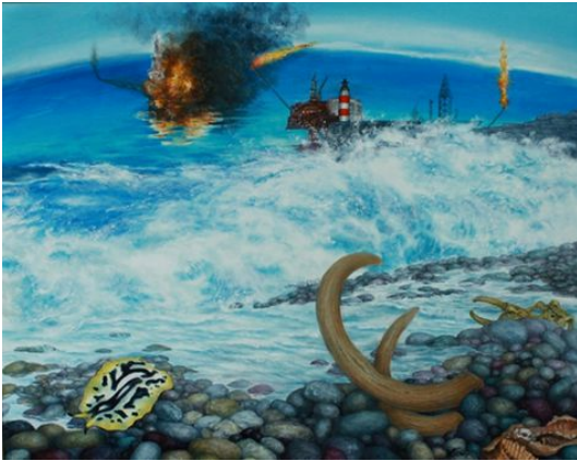
FLATWORMS SURVIVED ALL CATASTROPHES