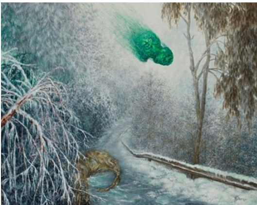
OUT OF ICE

Auch wenn es unterschiedliche Auffassungen gibt, ob Plattwürmer im Kambrium (vor etwa 541 bis 485,4 Millionen Jahren) oder bereits davor existierten, so steht fest, dass es sich um eine bereits vor Millionen von Jahren vorhandene Tiergruppe handelt. Sie überlebten das Aussterben der Mammuts ebenso, wie sie heutzutage scheinbar auch die menschlich verursachten Katastrophen wie brennende Ölbohrinseln und verseuchte Umwelt überleben.