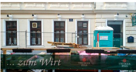
ZUM WIRT 2018