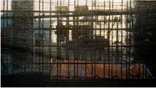
HINTER STOFF 2017