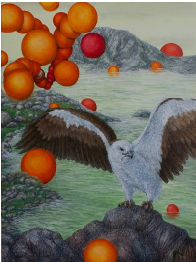
PARALLELUNIVERSEN WERDEN SICHTBAR

Der Klimawandel heizte den Planeten Erde dramatisch auf. Kein Leben kann unter diesen Bedingungen länger existieren. Alle uns bekannten Lebensformen sterben aus. Im Gegensatz zu früheren Leben vernichtenden Katastrophen ist keine Erholung möglich. Die Erde ist bereits zu nahe an der Sonne. Unser Planet hat die habitable Zone vorzeitig verlassen und wird verglühen. Entkommt das Papageien-Auge dem Inferno und kann es sich auf einen anderen Planeten retten?